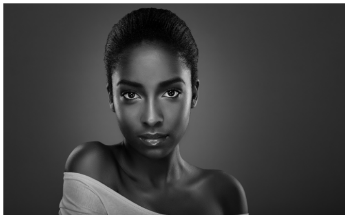
"Jada" di Kamal Mostofi - 1° Premio "Ritratto" XXXV ed.