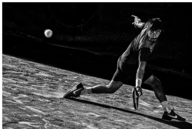
"Backhand 01" di Giuseppe Bernini - 1° Premio "Tema libero" XXXV ed.

è possibile inviare fotocopie delle schede